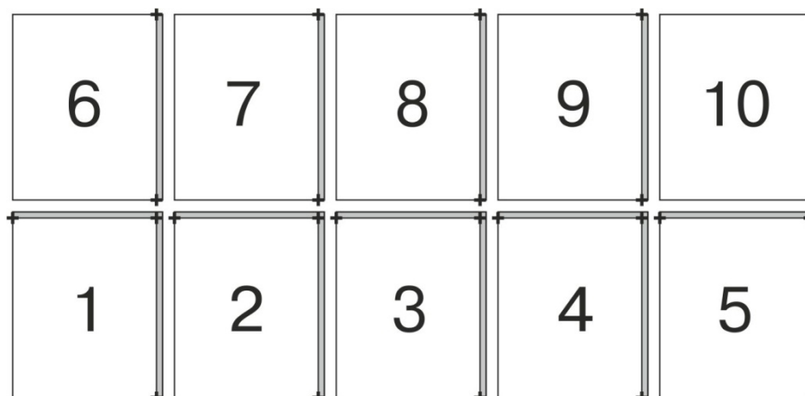
СХЕМА фрагментов постеров 6х3 м

серым фоном показаны нахлесты 1-2 см, «+» - кресты для совмещения фрагментов.